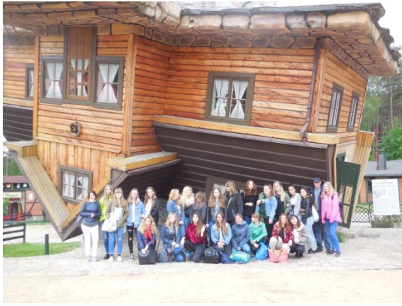
Freilichtmuseum der Kaschuben Szymbark